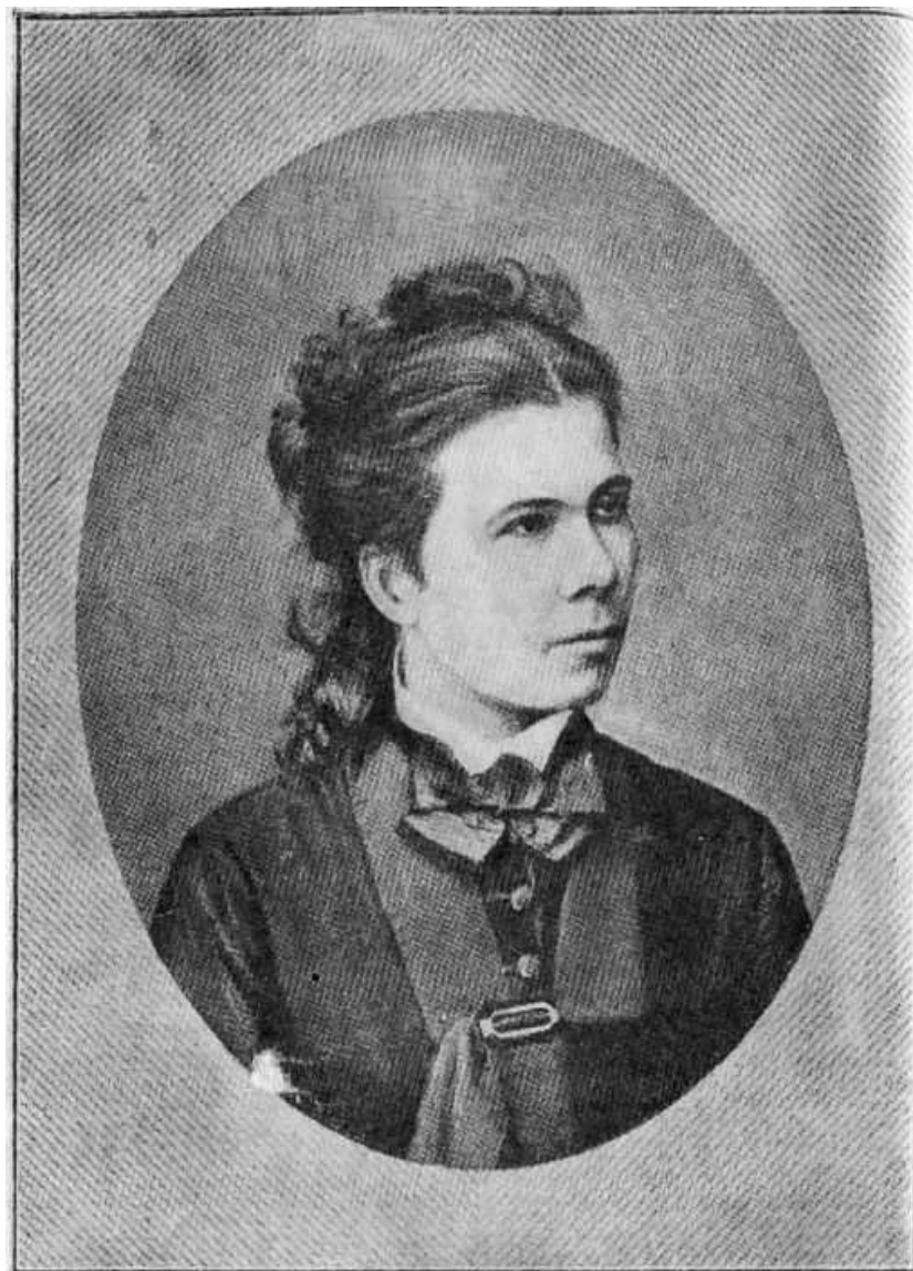
Надежда Прокофьевна Сулова (1843 – 1918)

Первая русская женщина, получившая диплом доктора медицины - в Цюрихском университете в 1867г. В России ей пришлось повторно сдать государственные экзамены, чтобы получить право на врачебную практику. Работала акушером-гинекологом.